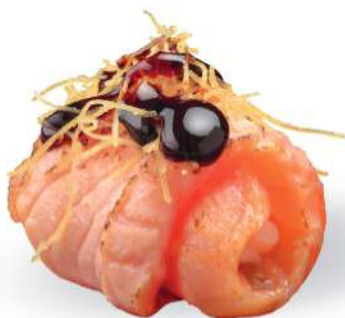
151 DUTOU SAKE Tempura de salmón*, philadelphia, salsa teriyaki, kataifi*, salmón* sellado