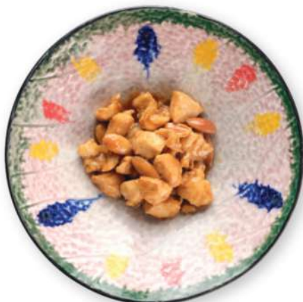
287 POLLO CON ALMENDRAS Pollo con almendras € 6,00