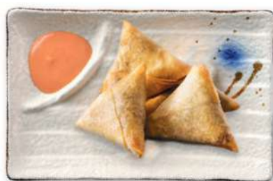
36 SAMOSA DE CAMARÓN Triángulos de croquetas de camarón* fritos