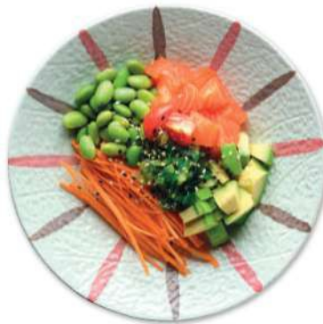
113 KAYI POKE Salmón*, algas, frijoles, aguacate, sésamo, arroz € 10,00