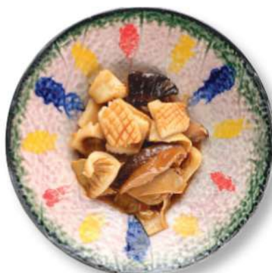
310 SEPIAS CON BAMBÚ Y HONGOS Sepias* con bambú y hongos