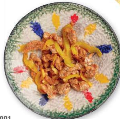
291 CERDO CON SAL Y PIMIENTA Cerdo salteado con sal y pimienta