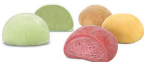
364-SORBETE DE LIMON € 4,00

1 gusto a elegir: FRESA- MANGO VANILLA- TE VERDE - COCO € 4.00