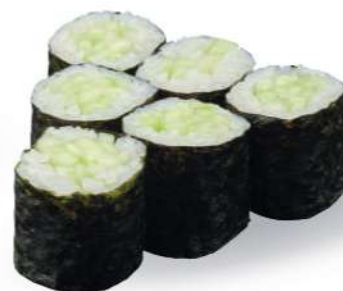
192 KAPPA MAKI Pepino