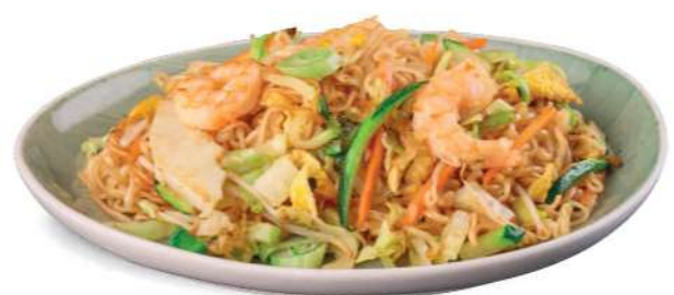
87 RAMEN KAISEN Ramen salteado con mariscos mixtos*, verduras y huevos