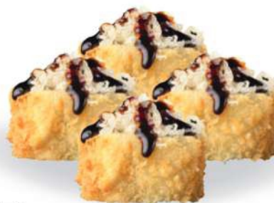
179 URAMAKI FRITO (4pz) Aguacate, surimi*, salmón*, salsa teriyaki, migajas de tempura € 5,00