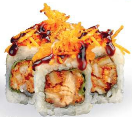
246 TORI CHEESE FIRE Pollo frito, ensalada, queso tostado, zanahorias fritas, salsa sweet chili, sésamo