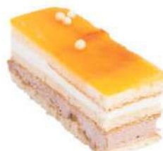
362-REINA € 5,00

Bizcocho artesano de chocolate, nata, mermelada de cereza y frambuesa, virutas de chocolate negro, azúcar buket y cacao.