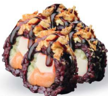
216 BLACK CALIFORNIA PLUS Arroz negro, surimi*, pepino, salmón*, sésamo, cebolla frita, mayonesa, salsa teriyaki