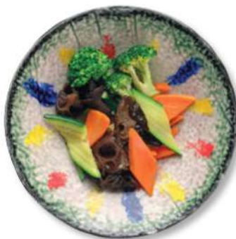
77 VERDURAS DE TEMPORADA SALTEADAS AL WOK Verduras mixtas de temporada salteadas al wok