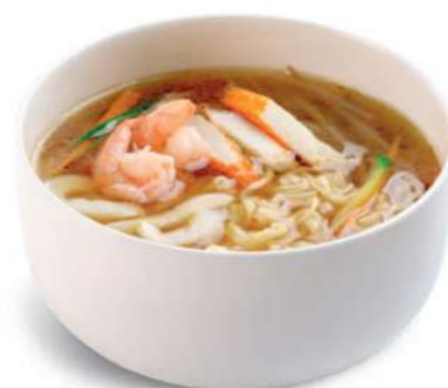
62 RAMEN CON PESCADO Fideos en caldo con mariscos mixtos* € 8,00