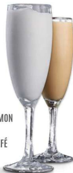
365-SORBETE DE CAFÉ € 4,00