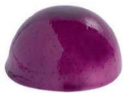
352-PASTEL QUESO DE CABRA € 5,00

Mousse gianduja, crujiente de avellana y bizcocho genovés.