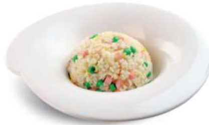
81 ARROZ 3 DELICIAS Arroz con huevos, guisantes* y jamón cocido