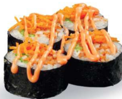
186 FUTOTORI Pollo*, ensalada, spicy mayo, zanahorias fritas € 6,00