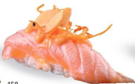
159 SHAKE FLAMBÈ SPICY Salmón* sellado, salsa spicy maio, almendras crujientes, zanahorias