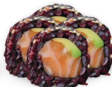
217 BLACK SALMON Arroz negro, salmón*, aguacate