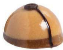
354-DE CAFÉ BOMBA € 5,00

Mousse de queso de Philadelphia, cremoso de frambuesa y bizcocho genovés.