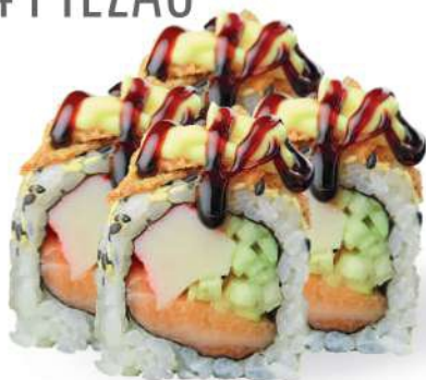
219 CALIFORNIA PLUS Surimi*, pepino, salmón*, sésamo, cebolla frita, mayonesa, salsa teriyaki