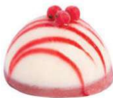
353-PASTEL CHEESECAKE € 5,00

Mousse de queso de cabra, confitura de pétalos de violeta y bizcocho genovés.