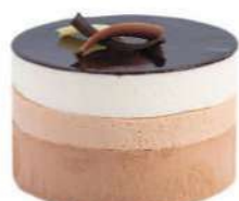
356-PASTEL TRES CHOCOLATES € 5,00

Mousse de chocolate blanco, bizcocho artesanal de chocolate, frambuesas, mousse de frambuesa y frutas silvestres.