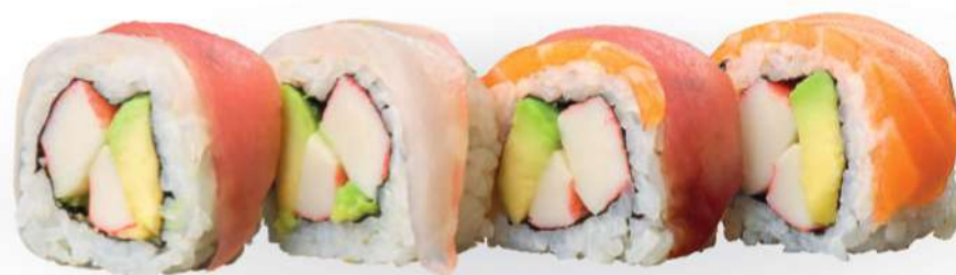
231 RAINBOW Surimi*, aguacate, pescado variado* crudo