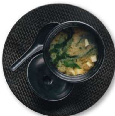
73 SOPA DE MISO Miso, algas, tofu