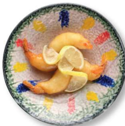
305 GAMBAS AL LIMÓN Gambas* en tempura con salsa de limón