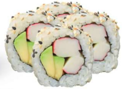
230 CALIFORNIA Surimi*, aguacate, sésamo