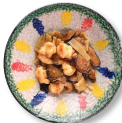
307 GAMBAS CON BAMBÚ Y HONGOS Gambas* con bambú y hongos