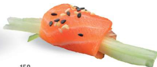
150 DUTOU SAKE Y VERDURAS Pepinos, philadelphia, salmón* y sésamo