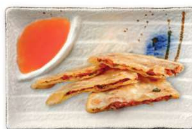
37 EMPANADA CHINA Rellena de salchicha y chucrut