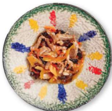
292 CERDO PICANTE Cerdo picante con pimientos