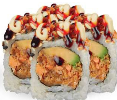
214 SAKE COCIDO PLUS Salmón* cocido, aguacate, mayonesa, salsa teriyaki, sésamo