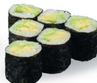
198 AVO MAKI Aguacate