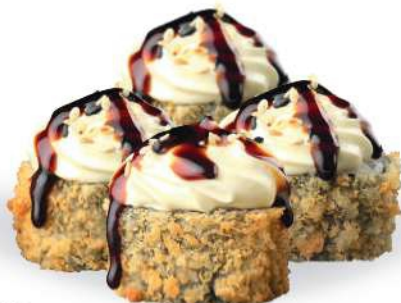
178 FUTOMAKI FRITO (4pz) Salmón*, aguacate, surimi*, philadelphia, salsa teriyaki, sésamo € 5,00