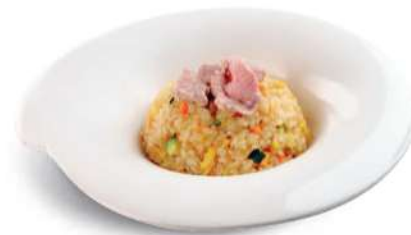
84 TENSHINHAN Arroz con carne de res, huevos y verduras