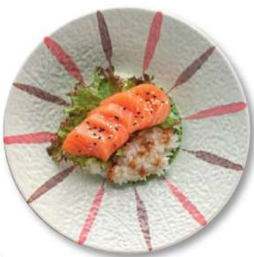
110 CHIRASHI SAKE DON Arroz cubierto de salmón* € 8,00