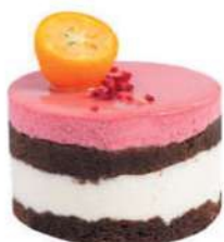
355-PASTEL FRAMBOLA € 5,00

Mousse de pasión y mango, trocitos de mango y bizcocho genovés.