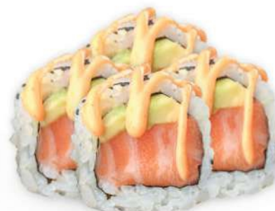
221 SPICY SALMON Salmón*, aguacate, salsa picante