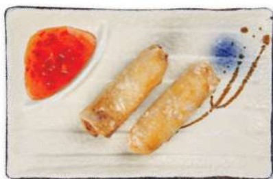
23 ROLLITOS VIETNAMITOS Pollo, fideos, cebollas, zanahorias, salsa de pescado