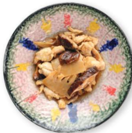
288 POLLO CON BAMBÚ Y HONGOS Pollo con bambú y hongos € 6,00