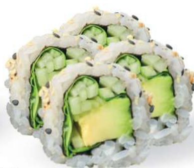
235 VEGGY MAKI Aguacate, ensalada