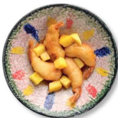
304 GAMBAS EN SALSA AGRIDULCE Gambas* en tempura con salsa agridulce