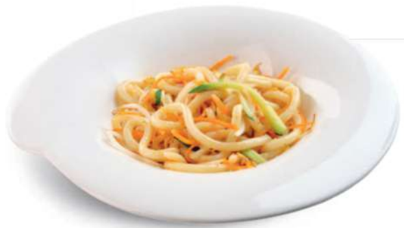
89 YASAI UDON Fideos japoneses con huevos y verduras