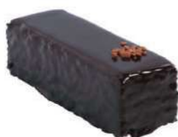
359-SACHER € 5,00

Mousse gianduja, crujiente de avellana y bizcocho genovés.