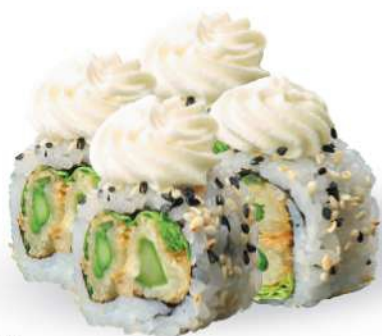
234 ASPARAGO MAKI Tempura de espárragos*, philadelphia, ensalada y sésamo