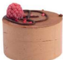
357-PASTEL SIN AZUCAR € 5,00

Bizcocho genovés, mousse de chocolate blanco, chocolate con teche y chocolate negro