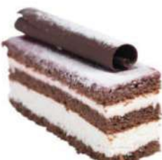
361-SELVA NEGRA € 5,00

Bizcocho artesano de chocolate negro, mousse de frutas del bosque, mermelada de frambuesa y frutos silvestres.