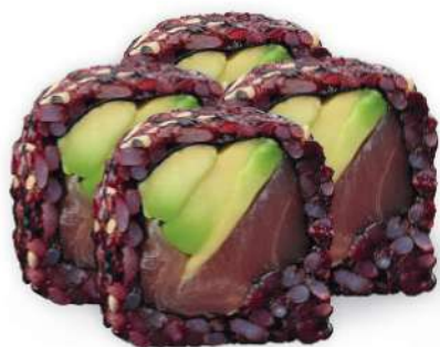
225 BLACK TUNA Arroz negro, Atún*, aguacate