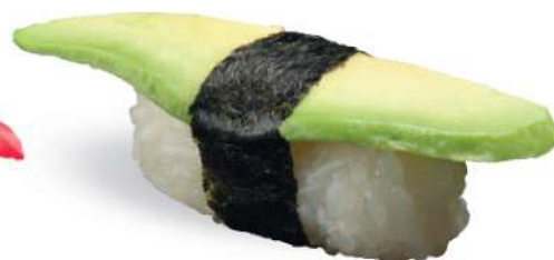
167 AVOCADO Aguacate