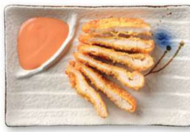
27 POLLO FRITO pollo* frito