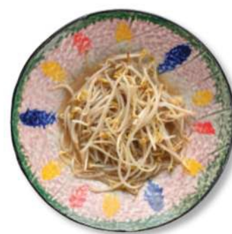
78 BROTOS DE SOJA SALTEADOS AL WOK Brotos de soja salteados al wok