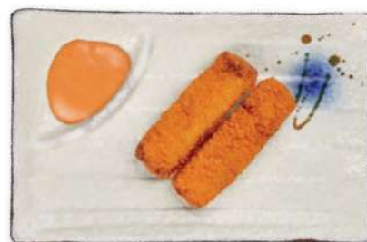
32 FILETE DE PESCADO Filete de pescado frito