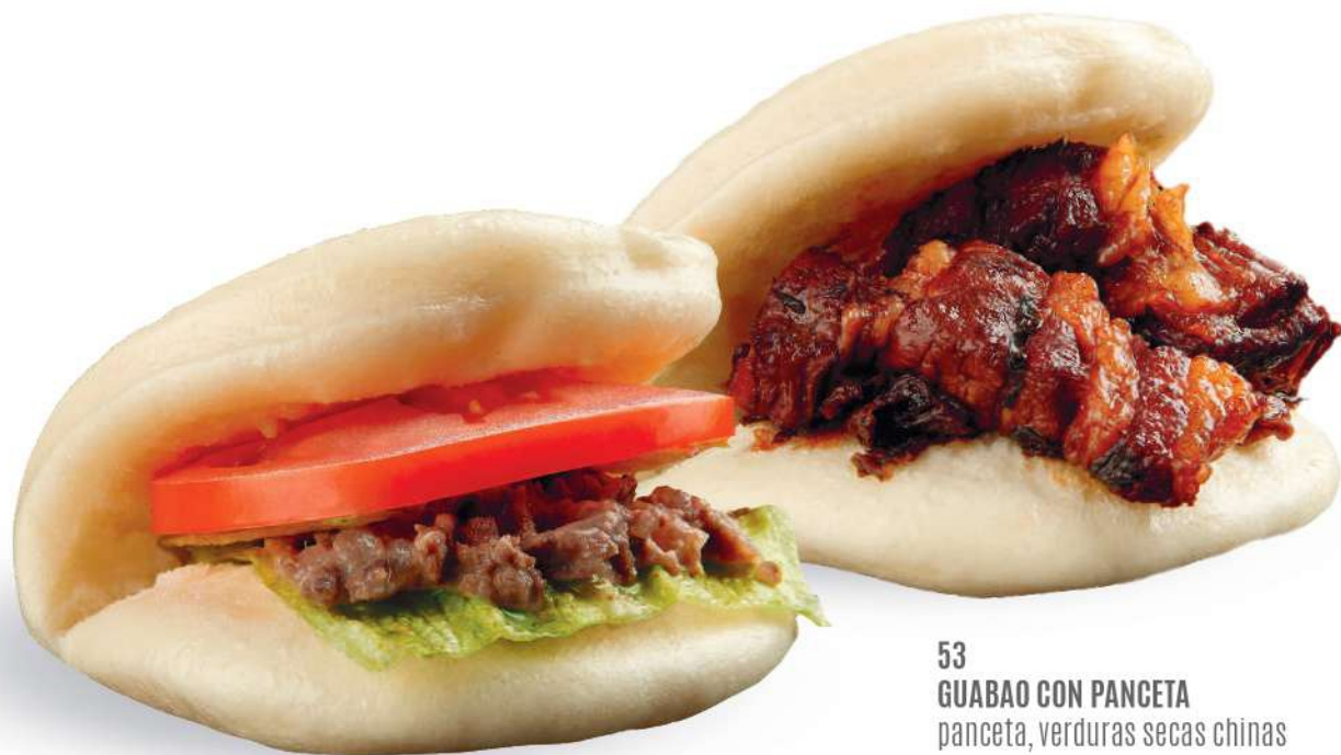
52 GUABAO CON TERNERA Carne de res, tomate, ensalada