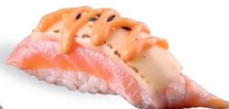
160 SHAKE CHEESE FIRE Salmón* sellado, queso, spicy maio