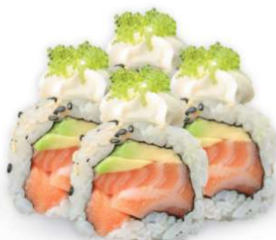
220 PHILADELPHIA Salmón*, aguacate, philadelphia, tobikko*