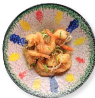
306 GAMBAS CON SAL Y PIMIENTA Gambas* salteados con sal y pimienta