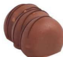
364-PASTEL FERRERO € 5,00

Mousse de fruta de la pasión y mango, mousse de chocolate blanco, merengue, bizcocho de chocolate y frutas silvestres.