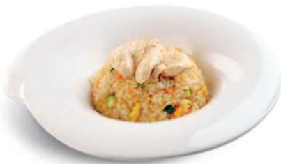
83 TORI MESHU Arroz con pollo*, huevos y verduras