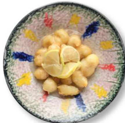
285 POLLO CON LIMÓN Pollo* rebozado con salsa de limon € 6,00