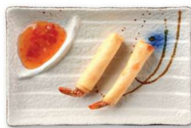
22 ROLLITOS DE CAMARONES Rollitos rellenos de camarones*