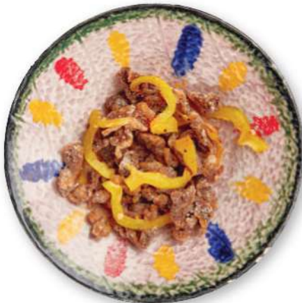
284 CARNE DE RES SAL Y PIMIENTA Carne de res sal y pimienta € 5,00