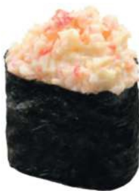
141 CALIFORNIA Cangrejo*, mayonesa, arroz