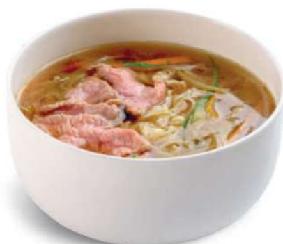
61 RAMEN CON CARNE DE RES Fideos en caldo con carne de res € 8,00