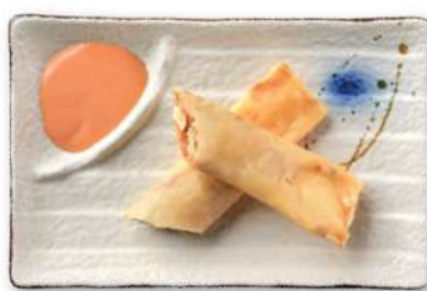
21 ROLLITOS DE SALMÓN Rollitos de salmón* fritos