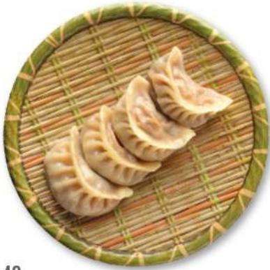
40 RAVIOLI DE CARNE Raviolis rellenos de carne y verduras