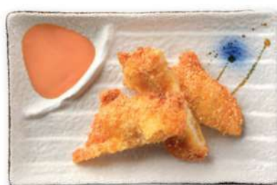
35 PESCADO FRITO Pescado frito*