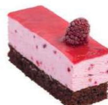
360-FRUTOS ROIOS € 5,00

Bizcocho artesano de chocolate negro, mermelada de albaricoque, ganache de chocolate y mirror de chocolate.