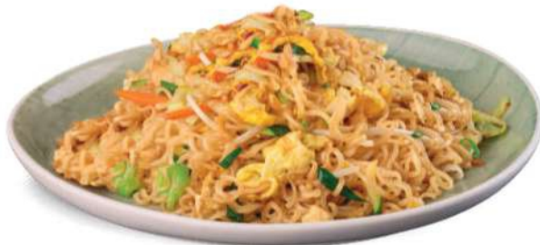
86 RAMEN YASAI Ramen salteado con zanahorias, calabacines, brotes de soja y huevos