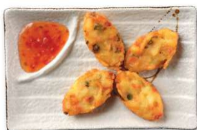
26 CROQUETAS DE VERDURAS Croquetas de patata con relleno de verduras