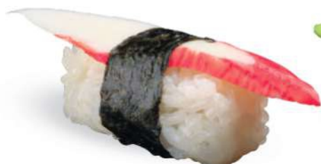
162 KANI Surimi*