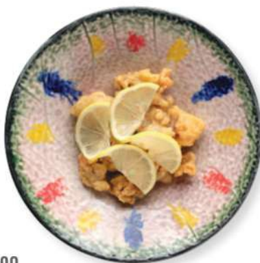
290 CERDO AL LIMÓN Cerdo en tempura frito con salsa de limón