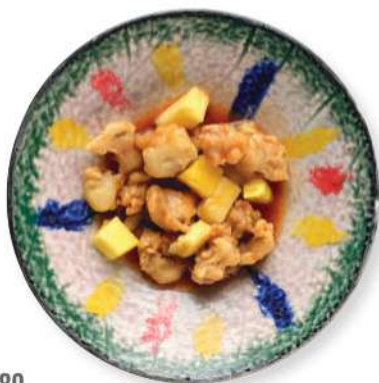
289 CERDO AGRIDULCE Cerdo en tempura frito, salsa agridulce