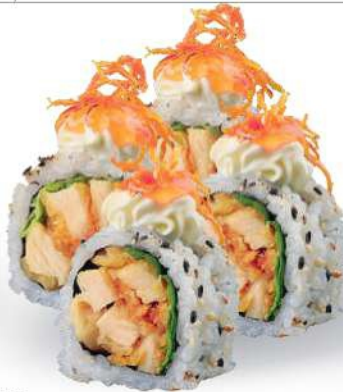
245 TORI PHILLY Pollo*, ensalada, philadelphia, salsa sweet chili, zanahorias fritas, sésamo