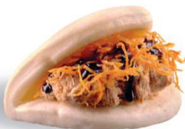
55 SHAKE GUABAO Salmón* cocido, zanahorias fritas, salsa teriyaki € 5,00