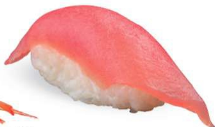
164 MAGURO Atún*