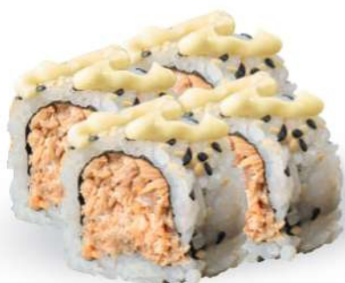
213 SAKE COCIDO Salmón* cocido, mayonesa, sésamo