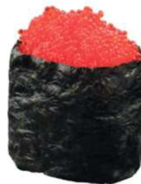
142 TOBIKKO Huevas de pez volador* y arroz