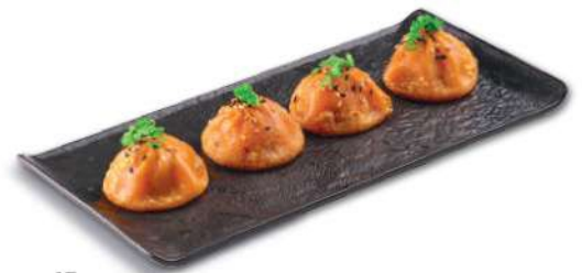
45 BAO POLLO Con tomate, pollo, col, cebolla, cebollino, ajo, sesamo y pimienta