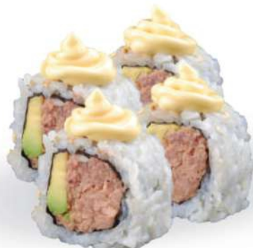
223 PHILLY TUNA Atún cocido, aguacate, mayonesa