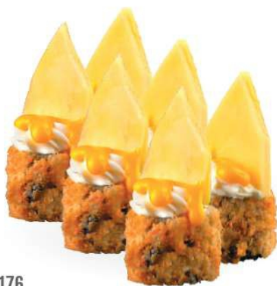
176 MANGOMAKI (6pz) Salmón*, philadelphia, mango y salsa de mango € 6,00