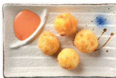
34 CROQUETAS DE CAMARÓN Croquetas de patata rellenas de camarones*