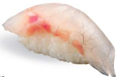
169 SUZUKI Branzino*