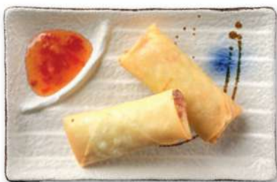
20 ROLLITOS DE VERDURAS Rollitos rellenos de verduras