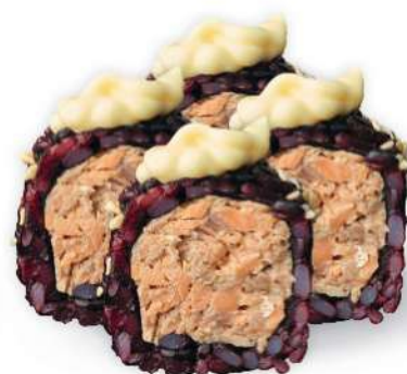
215 BLACK SAKE COCIDO Arroz negro, salmón* cocido, mayonesa, sésamo