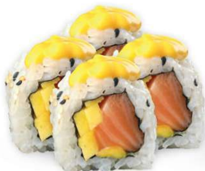
222 SALMON MANGO Salmón*, mango, salsa de mango y philadelphia