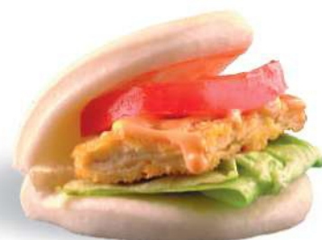
56 CRUNCHY FISH GUABAO Pescado frito, ensalada, tomate, spicy mayonesa € 5,00