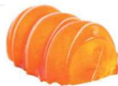
363-PASTEL MANDARINA, PASION Y MANGO € 5,00

Mousse de café y caramelo, cremoso de café y bizcocho genovés de chocolate.