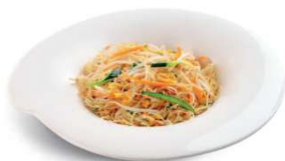
93 ESPAGUETIS DE ARROZ CON VERDURAS Spagueti de arroz con verduras y huevos € 5,00