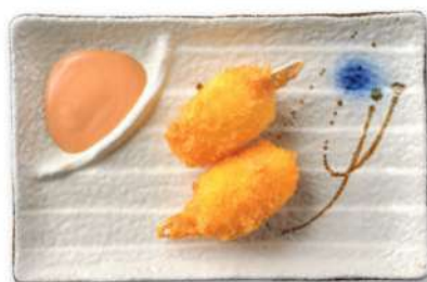
33 PINZAS DE CANGREJO Pinzas de cangrejo* fritas