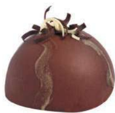
351-PASTEL FERRERO € 5,00

Mousse gianduja, crujiente de avellana y bizcocho genovés.