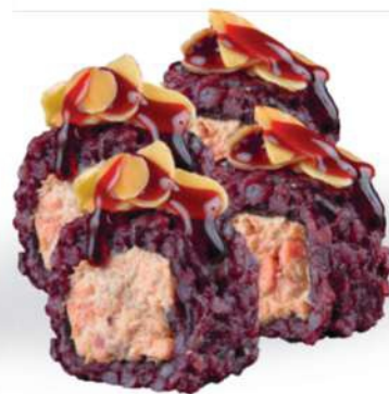
212 BLACK SALMON MANDORLA Salmón* cocido, arroz negro, almendras, salsa teriyaki, philadelphia