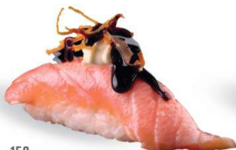
158 SHAKE FIRE Salmón* sellado, salsa teriyaki, philadelphia, zanahorias