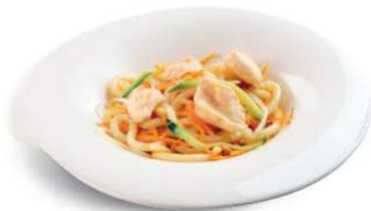
90 TORI UDON Fideos japoneses con pollo*, huevos y verduras