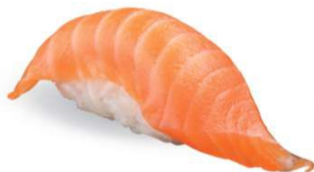
161 SAKE Salmón*