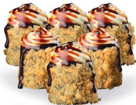
177 HOSO FRITO (6pz) Salmón*, philadelphia, sésamo € 5,00