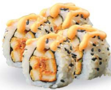
244 TORI MAKI Tempura de pollo*, salsa picante, ensalada, sésamo