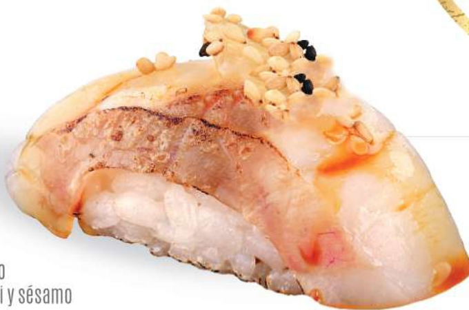
170 SUZUKI FIRE Branzino* sellado con salsa teriyaki y sésamo