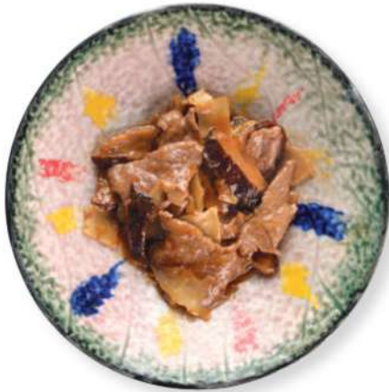
280 CARNE DE RES CON BAMBÚ Y HONGOS Carne de res con bambú y hongos € 8,00

CARNE DE RES - POLLO CERDO - PATO - PESCADO