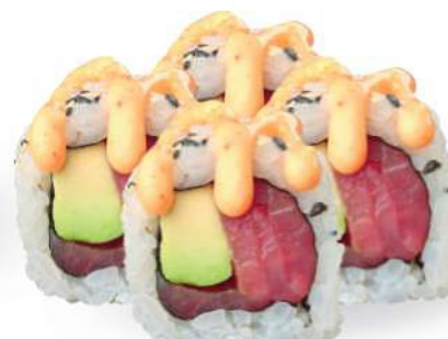
224 SPICY TUNA Atún*, aguacate, salsa picante