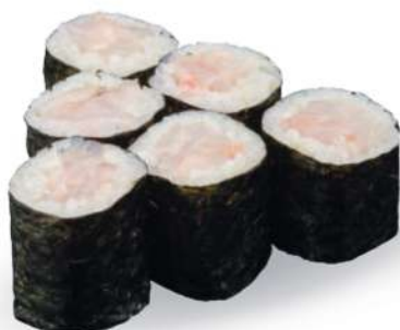
193 SUZUKI MAKI Branzino*