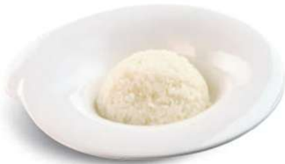
80 ARROZ BLANCO Arroz blanco