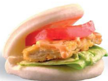
54 TORI GUABAO Pollo frito, ensalada, tomate, spicy mayonesa € 5,00