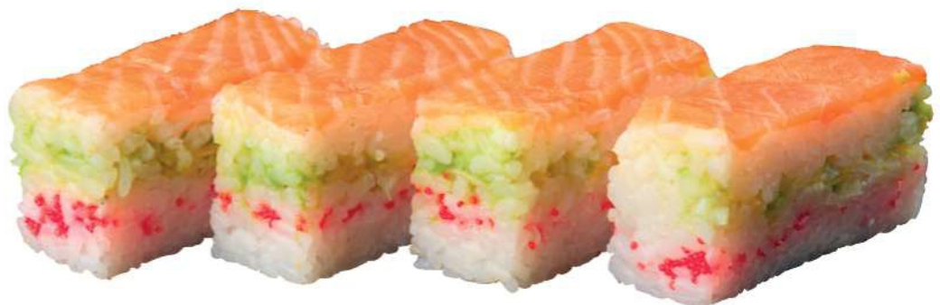
247 KAYI SANDWICH MAKI Salmón*, atún*, aguacate, tobikko*