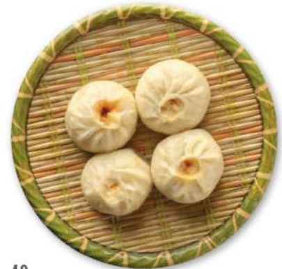
42 XIAO LONG BAO Dumplings rellenos de carne y hongos shiitake