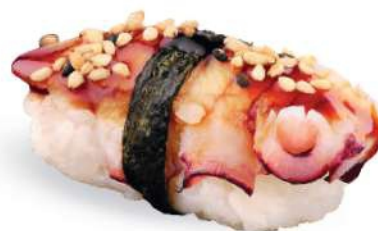
166 TAKO Pulpo* cocido con salsa teriyaki, sésamo tostado