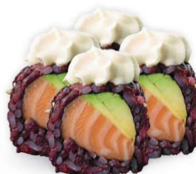
218 BLACK PHILADELPHIA Arroz negro, salmón*, philadelphia, aguacate