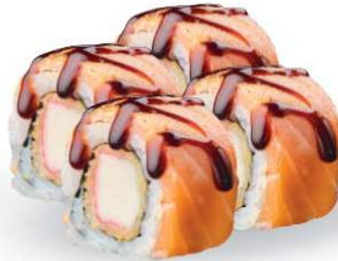
229 KAYI MAKI Tempura de surimi*, salmón* salteado