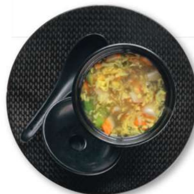
72 SOPA DE ESPÁRRAGOS Espárragos*, cangrejo*, huevo, almidón de patata