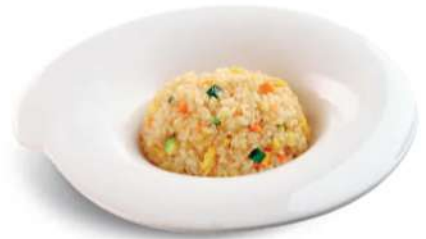
82 YASAI MESHU Arroz con huevos y verduras