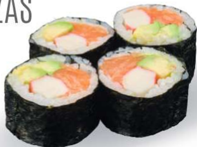
185 FUTOMAKI Salmón*, aguacate, surimi* € 6,00