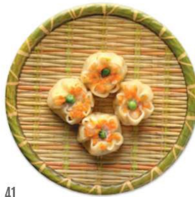
41 SHAO MAI Dumplings rellenos de carne y camarones*