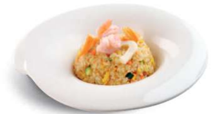
85 YAKI MESHU Arroz con camarones*, huevos y verduras