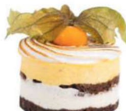
358-PASTEL TENTACION € 5,00

Mousse de chocolate sin azúcar y frambuesas.