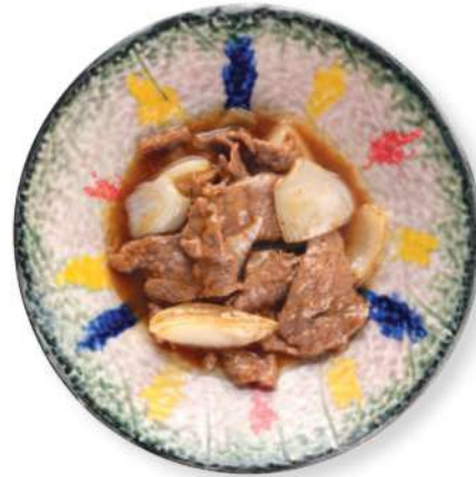
281 CARNE DE RES CON CEBOLLA Carne de res con cebolla € 8,00