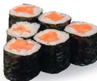
194 SAKE MAKI Salmón*