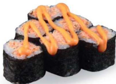
196 MIURA SPICY Salmón* a la plancha, salsa picante