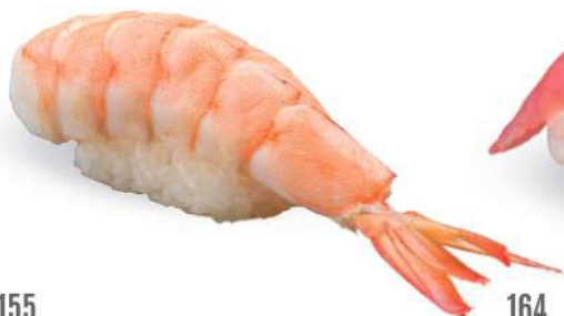
155 EBI Camarón* cocido